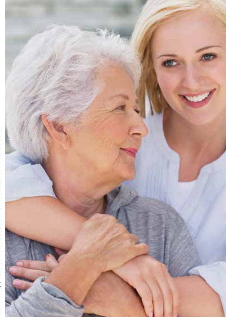
E.R. : Lobélia et Lobelys, Chaussée Brunehaut 402, 4041 Vottem. Photos non contractuelles.