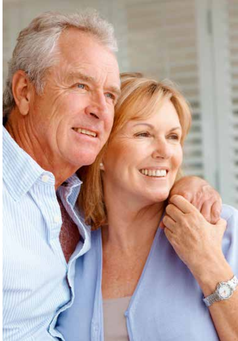
V.U.: Damiaan, Pater Damiaanstraat 39, 3120 Tremelo. Niet-bindende foto's